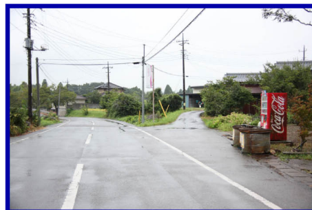
自販機が見えたら右側道へ (ミラーのT字路から約1km地点)