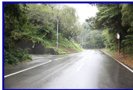
ミラーのあるT字路を左へ