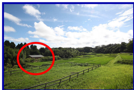
農道に入ると左に見えるのが 当スタジオです